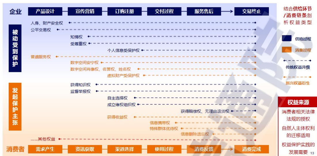
图 1 数字消费者权益图谱