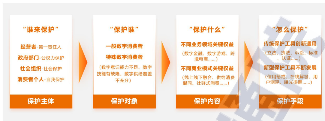
图2 数字消费者权益的保护框架