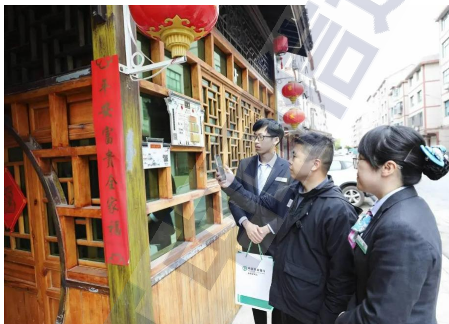
图4 村民通过“数字乡村”平台提交融资需求

解决融资难题，助力农民农村共同富裕。村民通过扫描门口智慧门牌上的二维码，选择“我要存”“我要贷”“我要保”等模块，即可享受农行高效便捷的金融服务。该平台作为集乡村“智治”、生活商圈、金融惠农等功能于一体的智慧平台，既为乡村振兴提供了数字服务，也为村两委开展村务管理和应急管理提供了一站式平台，有效助力当地政府打造可视化、数字化、综合化的“智慧大脑”。