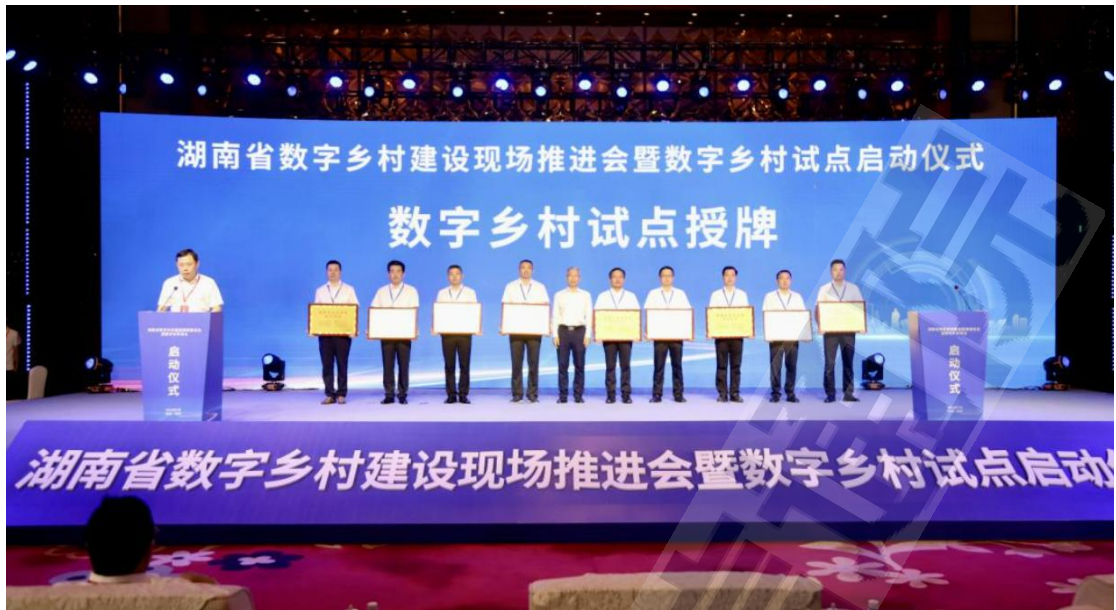
图3 湖南省首批数字乡村试点授牌