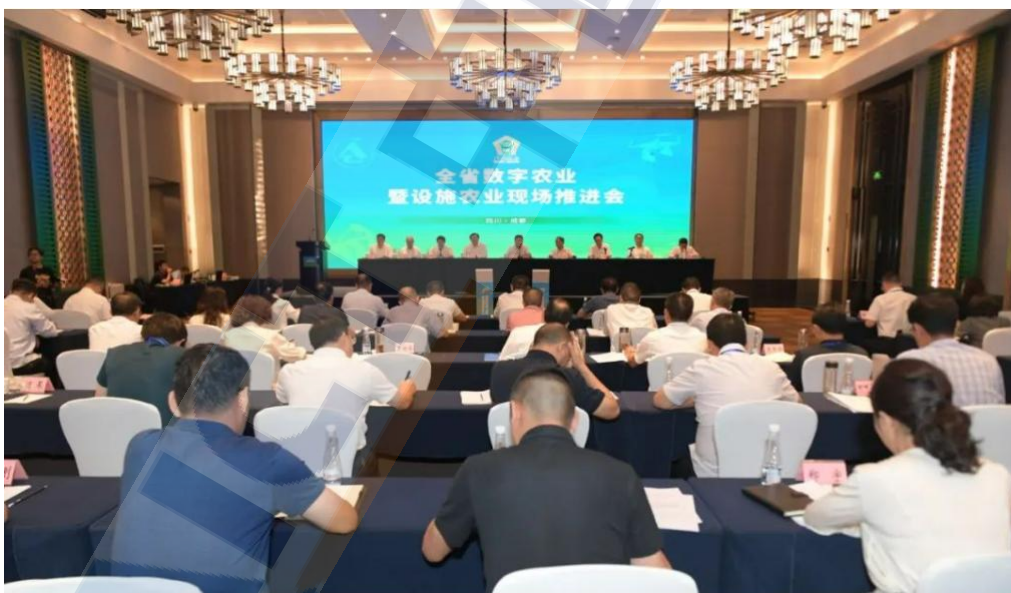
图1 四川省数字农业暨设施农业现场推进会现场

7月14日，四川省数字农业暨设施农业现场推进会在成都召开，省委网信办与农业农村厅签署战略合作框架协议，共同推进数字乡村发展等工作。协议明确了合作目标、合作内容、合作机制，提出了研究制定配套政策、探索建立标准体系、优化升级基础设施、加强财政资金支持、发展农村数字经济、加大网上宣传力度、加强网络舆情监测、协同保障网络安全、培育数字乡村人才、合力打造平台品牌等十大行动，确定了联席会议机制以及共同推动四川省乡村振兴取得新进展、农业农村现代化迈出新步伐的目标。