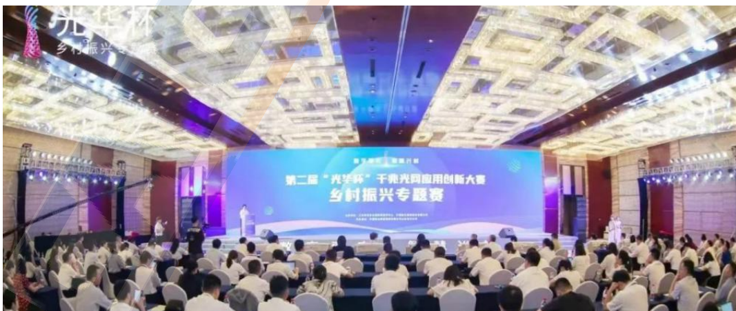
图2 第二届“光华杯”乡村振兴专题赛颁奖典礼暨数字乡村论坛活动现场

7月21日，以“数字惠农 智慧兴村”为主题的第二届“光华杯”千兆光网应用创新大赛乡村振兴专题赛（以下简称专题赛）颁奖典礼暨数字乡村论坛在山东济南成功举办。本届专题赛由工业和信息化部新闻宣传中心、中国联合网络通信有限公司主办，中国联合网络通信有限公司山东省分公司承办，共征集涵盖乡村基础设施建设、乡村治理、乡村产业发展、定点帮扶等领域的 1618 个项目，最终评选出 148 个获奖项目，对进一步推进千兆光网技术与数字乡村发展融合创新，助力我国农业农村现代化发展具有广泛的示范带动意义。