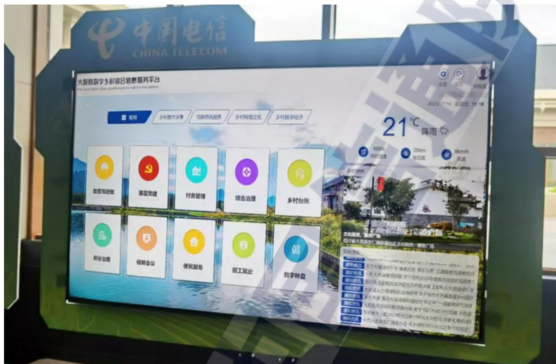
图5 大邑县数字乡村综合信息平台

乡村治理管理服务，实现高效管理，为基层减负；面向乡村老百姓提供政策公开、便民惠民等乡村一体化服务，实现数字赋能乡村振兴，村民幸福感持续提升。