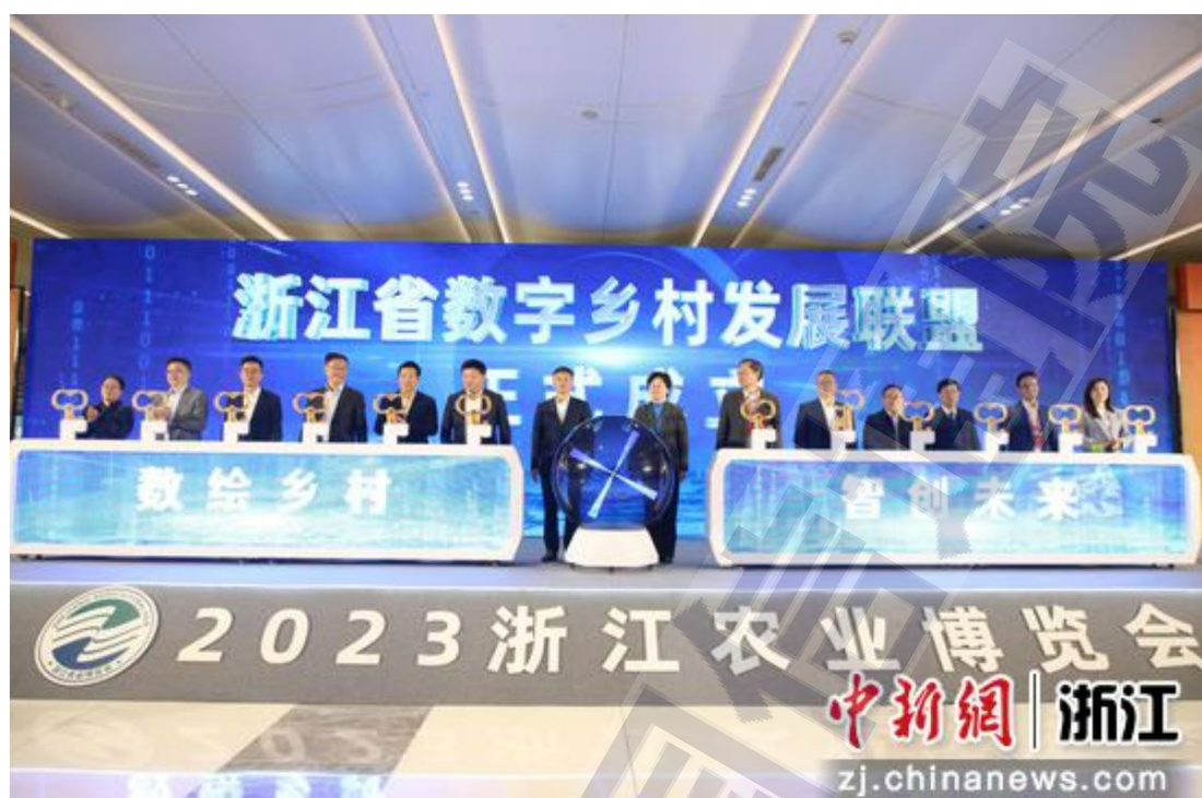
图 2 浙江省数字乡村发展联盟成立