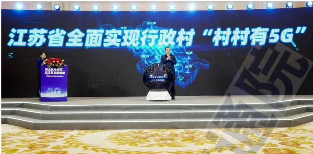
图3 江苏省“村村有5G”点亮仪式