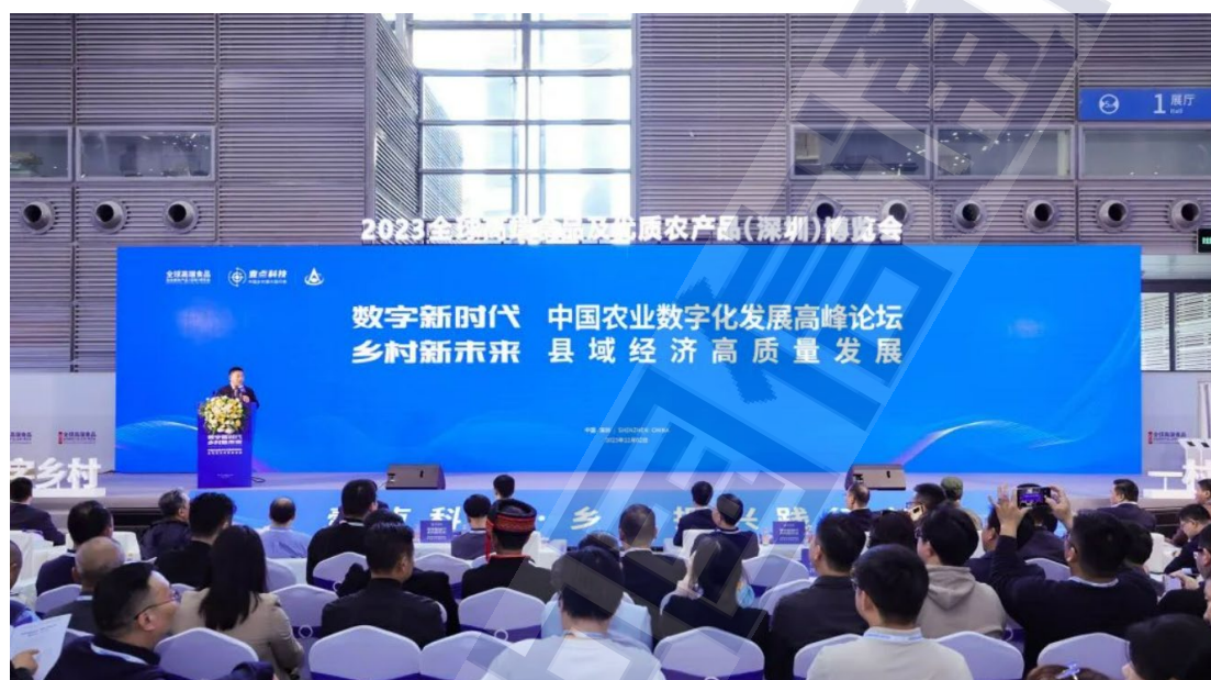
图 1 中国农业数字化发展高峰论坛现场

的责任与担当。会上，深圳市委农办发布了《关于发挥深圳数字化智能化优势，助力全国数字乡村高质量发展的行动计划》文件，把深圳与全省全国对接好，将深圳的数字化资源嫁接和植入，更好发挥辐射带动作用，为建设农业强国和加快农业农村现代化贡献深圳力量。