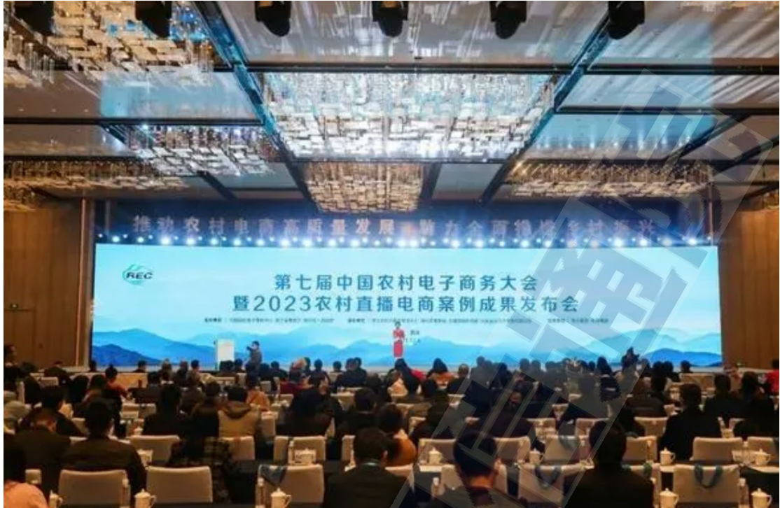
图1 第七届中国农村电子商务大会现场