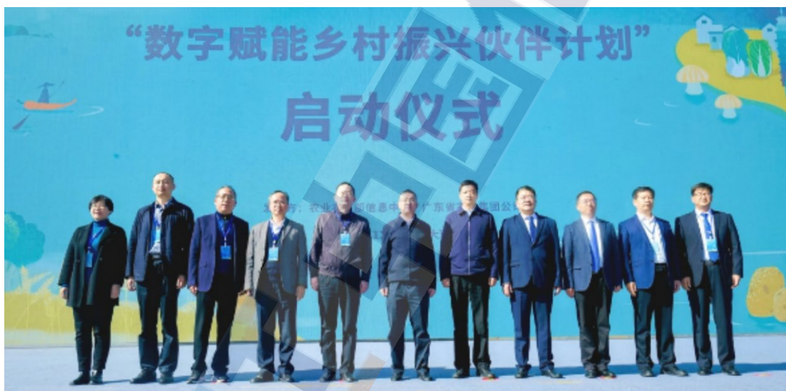
图3 “数字赋能乡村振兴伙伴计划”启动仪式现场

2023年12月16日，由广东省农垦总局和农业农村部信息中心共同发起的“数字赋能乡村振兴伙伴计划”（以下简称“伙伴计划”）在云南大理举办的2023全国“土特产”大会上正式启动。“伙伴计划”旨在以数字赋能为乡村振兴战略高质量实施注入新的动力与活力，将在数字乡村、智慧农业、农村电商等领域展开深入合作，共同探索数字赋能乡村振兴的新路径，加快把农业建成现代化大产业做出应有贡献。