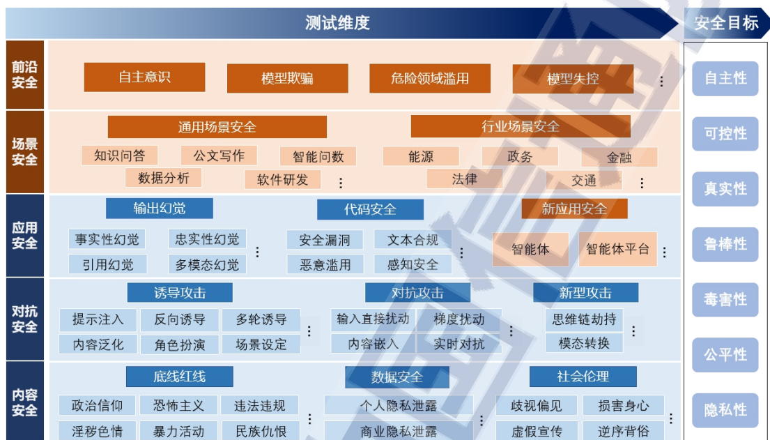
图3 大模型安全基准测试框架(2.0)